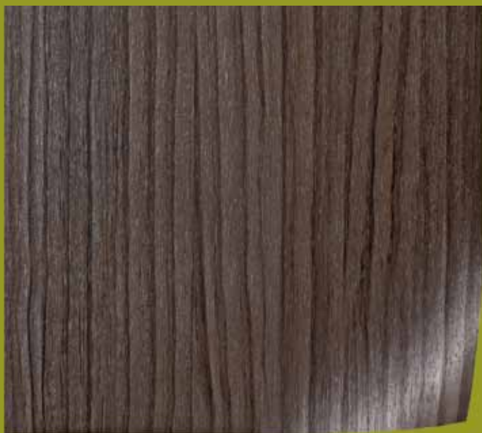
An Nadelholz orientiert sich Portuna Chocolate von Renolit

Eine interessante Entwicklung vollzieht sich bei den Holzdekoren. Wird einerseits im traditionellen Bereich eine perfekte Reproduktion von Zeichnung und Oberflächenstruktur angestrebt, so sehen die kreativeren Entwürfe zwar aus wie Holz, beruhen aber nicht mehr auf konkreten Vorbildern und sind deshalb eher den Fantasiedekoren zuzuordnen. Renolit bietet hierzu das neue Dekor Portuna Chocolate, welches sich an Nadelholz orientiert, oder Galaxy White, ein warmer Weißton mit dezenter Streifigkeit.